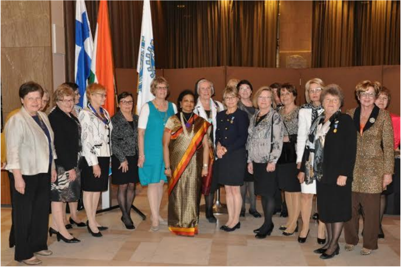
Inner Wheel –jäsenet yhteiskuvassa Juhlalounaalla Tapahtumatalo Bankissa