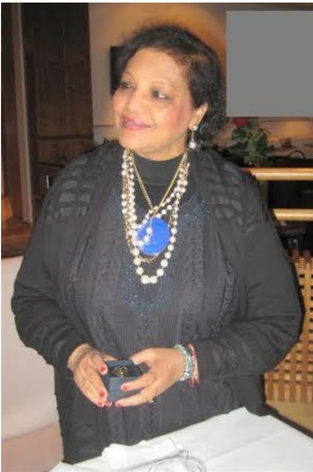
Vierailun päätteeksi IIW:n presidentille luovutettiin

Maanantaiaamuna oli presidentillä aikainen herätys. Lento seuraavaan kohteeseen nousi ilmaan Helsinki-Vantaalta kello 8 ja päätti Suomen vierailun.